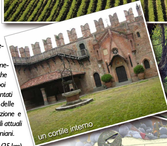
un cortile interno