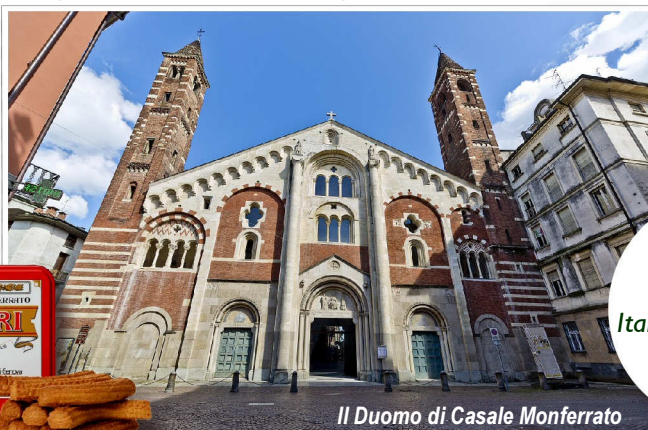
Il Duomo di Casale Monferrato

Per i partecipanti contributo per Italia Nostra di € 60 (con copertura assicurativa)