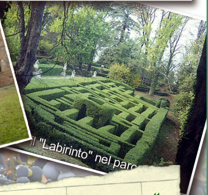
"Labirinto" nel parco